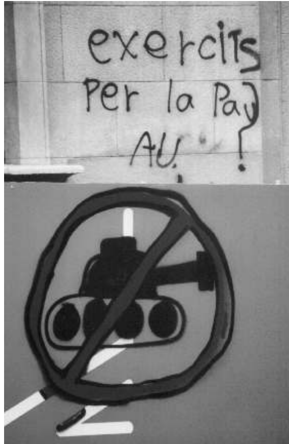
¿Ejércitos por la paz? ¡Anda ya!

Declaraciones de varias ONG: Este anuncio, sin embargo, volvió a provocar polémica. Cruz Roja negó su participación "tanto en el desfile como en la exposición en el Moll de la Fusta". Lo mismo dijo