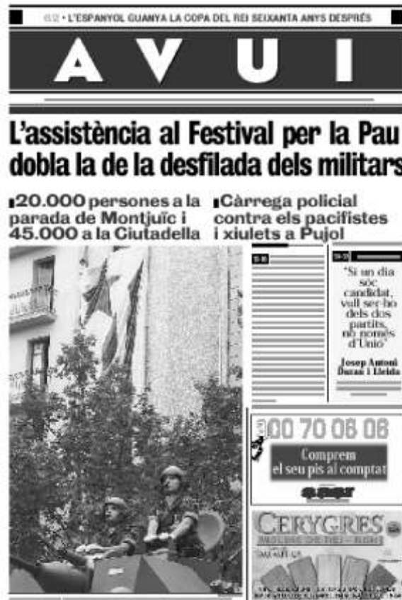
Portada del diario "Avui" del 28/5/2000

Declaraciones de Josep Antoni Duran Lleida, concejal de Gobernación: Duran Lleida relativizó los silbidos contra Jordi Pujol al calificarlos de "incidentes menores, en cierto modo lógicos en función del público."