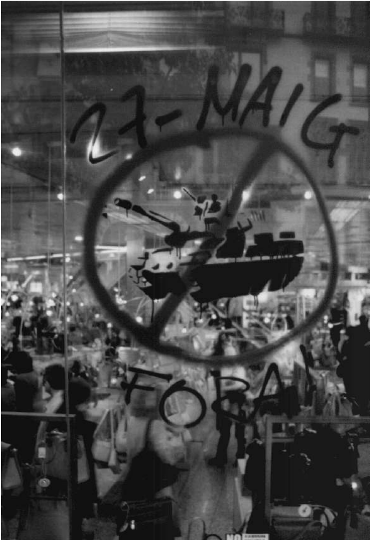
27 de Mayo. ¡Fuera! Pintado en el escaparate de unos grandes almacenes